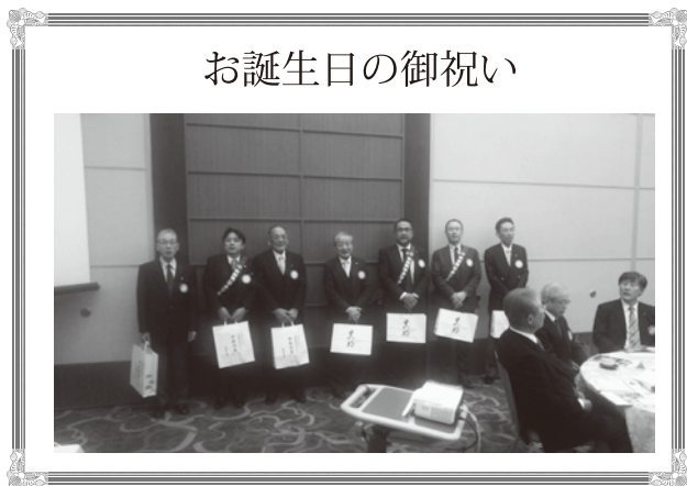
お誕生日の御祝い