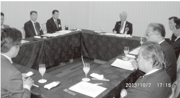
福家ガバナーとの懇談会