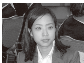
吹田ローターアクトクラブのみなさん