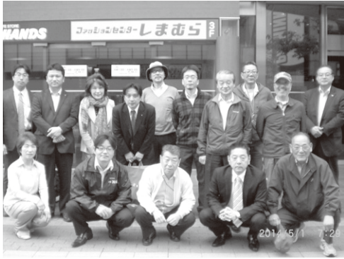
5月1日 吹田西RC主催 クリーンデー