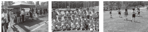
当クラブ参加者と後藤吹田市長のキックイン