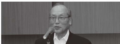
旭日小綬章を受章されたお礼のご挨拶をされました。