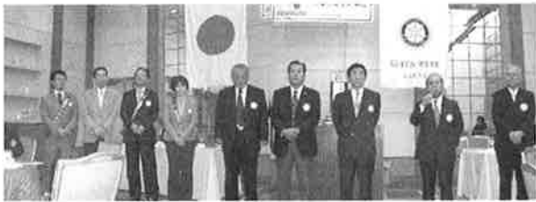
タイ訪問団 団結式