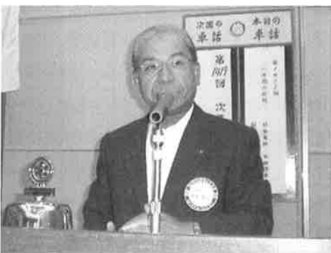
吹田西ロータリークラブ30周年記念事業 社会奉仕部門 「リオちゃんふる里に帰る」について

平成23年5月25日(水)豊津公園においてリ オちゃんの除幕式が行われ、遅くなりましたが、 これですべての30周年記念事業が終了いたし ました。