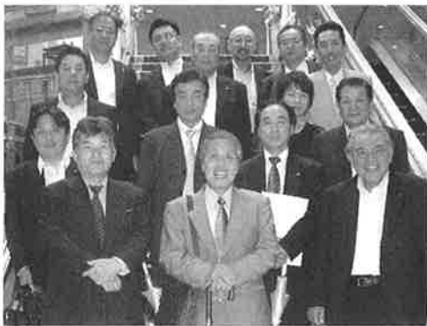
新・現合同理事会懇親会

4つのテストの理念に基づき慎重に協議致 しまして、全員一致で理事会承認と成りまし た。会員の皆様にも何卒ご理解の上ご承認 をお願い致します。