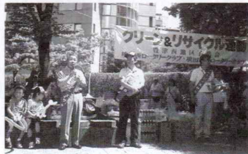
7月10日(日) クリーン・エサカ

に親しまれ、豊津公園のシンボルになって欲しいと話をしました。そして、喜んで頂けたと思います。又、当クラブも毎月江坂駅周辺の清掃活動をしている事も併せて紹介しました。