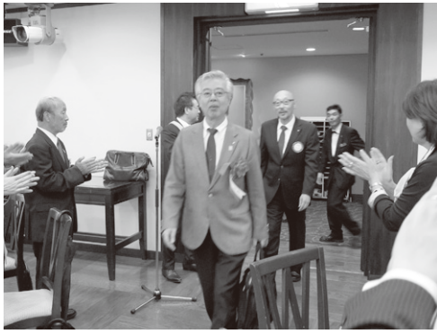
泉ガバナーご入場