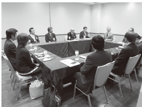
泉 博朗ガバナーとの懇談会