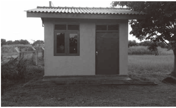
1. 写真1 当該プロジェクト関連