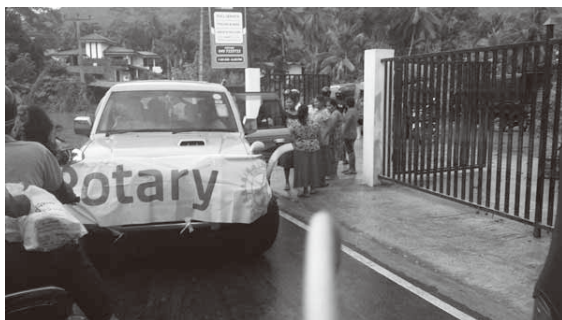
2. 写真2-4 直近の大雨による洪水と地滑りによる被害状況